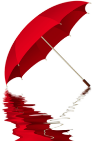
Un parapluie= an umbrella